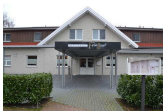
Eingang von Piazza