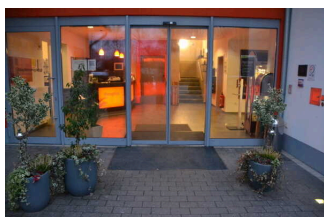
Eingang vom Hotel