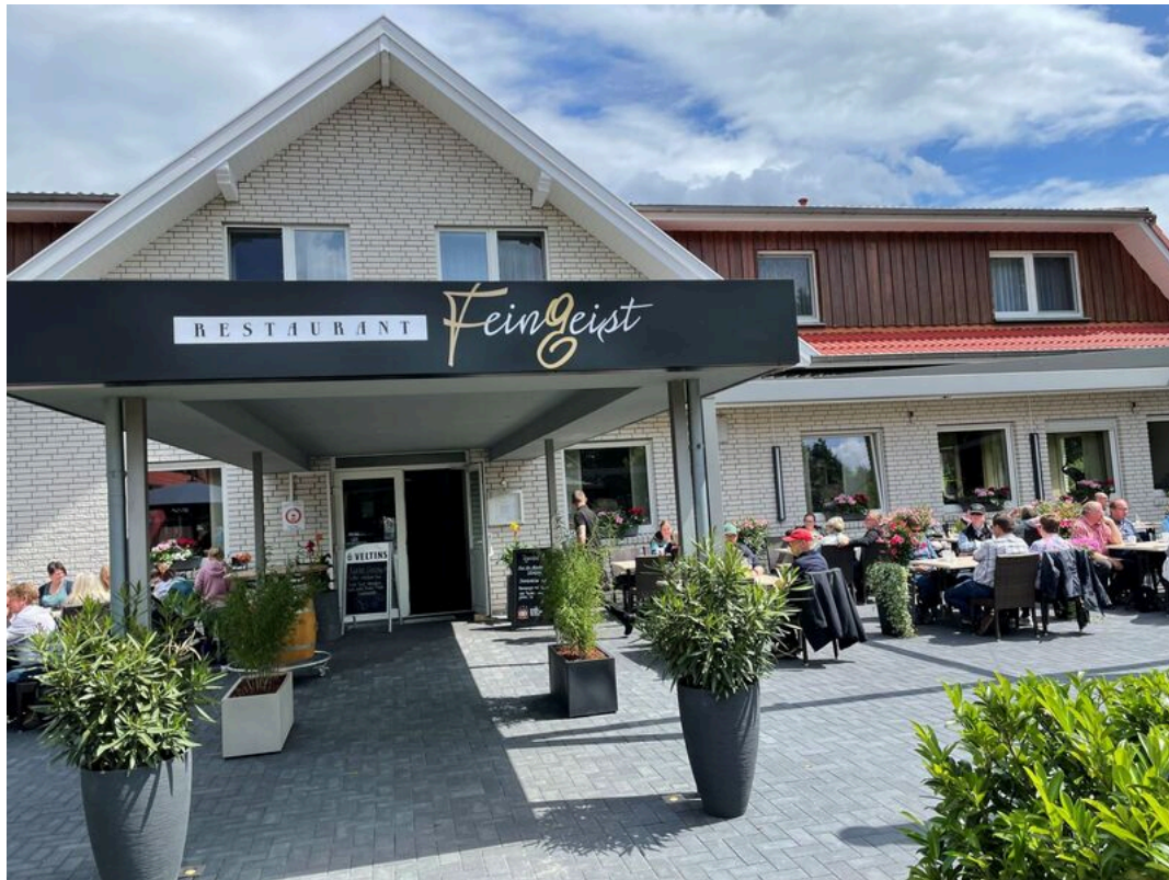
Terrasse Restaurant Feingeist | ©M Marquardt